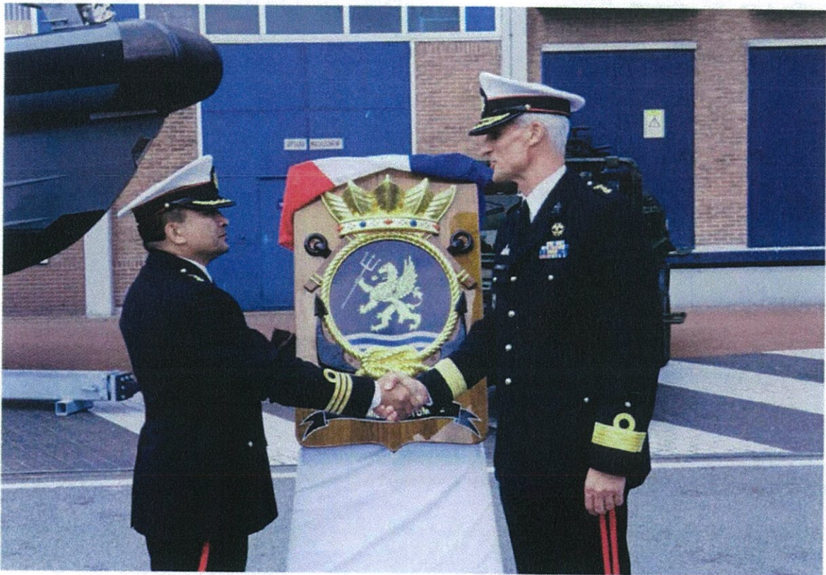
Het nieuwe embleem voor de Netherlands Maritime Special Operations Forces van het Korps Mariniers.