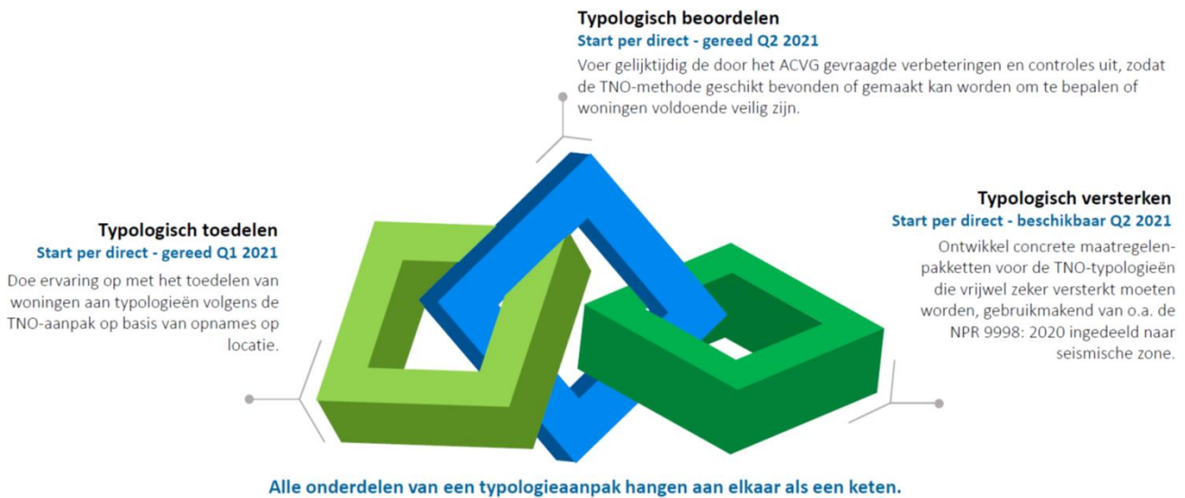
Figuur 2: De drie trajecten binnen de integrale aanpak.

met een beperkte versterkingsmaatregel alsnog binnen een typologie valt. Zo vormen typologisch toedelen, beoordelen en versterken één integrale keten (zie ook figuur 2).