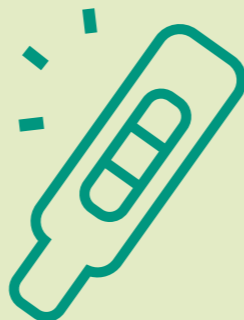
VROEG IN DE ZWANGERSCHAP