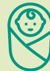
ROND DE GEBORTE