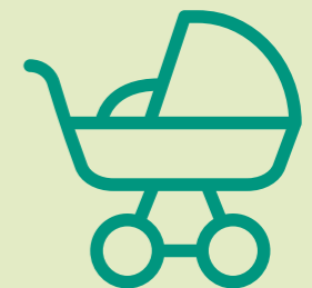
NA DE GEBORTE