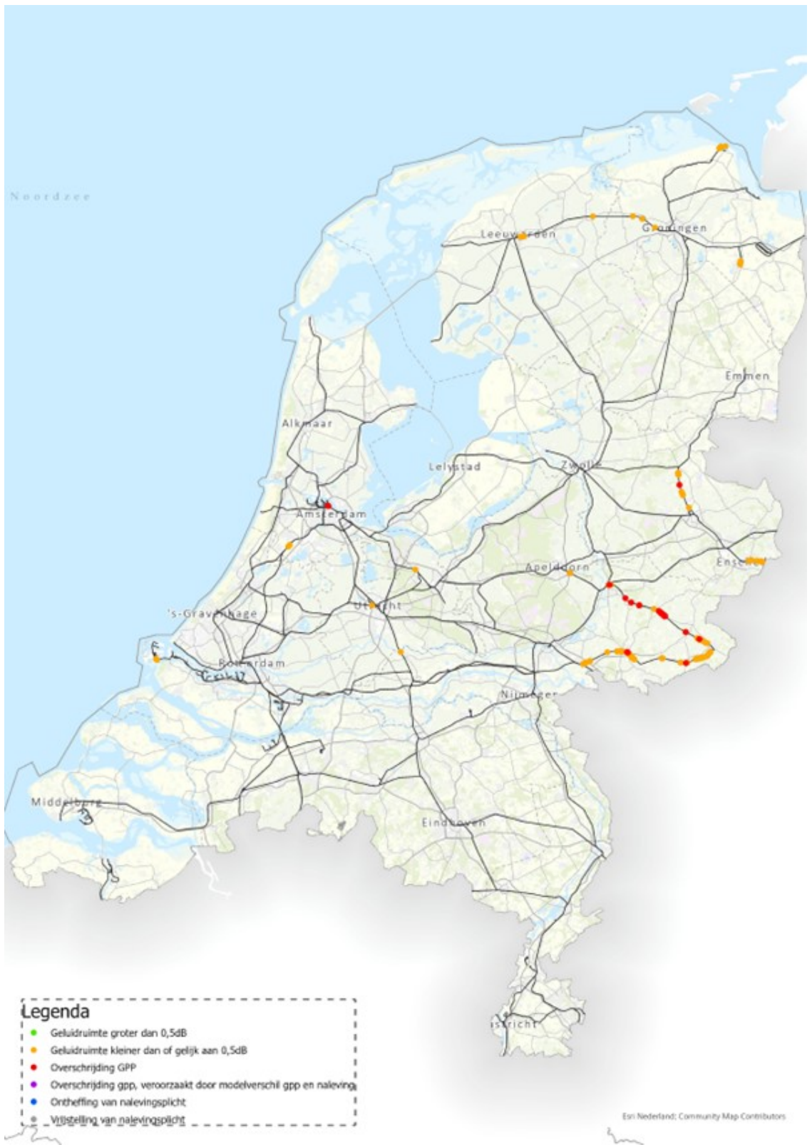
Figuur 1: Landelijk beeld van gpp-overschrijdingen en baanvakken met een krappe geluidruimte