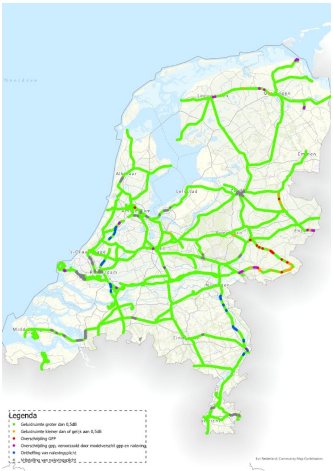
Figuur 2: Landelijk beeld van de gpp-naleving in 2022