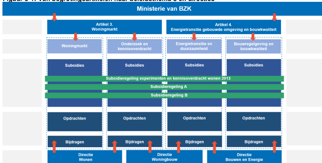
Figuur 3-1: Van begrotingsartikelen naar beleidsthema's en directies

Naast de uitgaven aan subsidies zijn in de Rijksbegroting de uitgaven aan opdrachten en de bijdragen aan andere organisaties, zoals medeoverheden en agentschappen, vastgelegd.